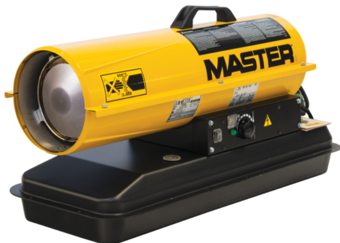
B 35 CEL