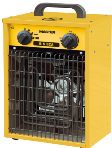
B 5 ECA