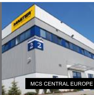
MCS CENTRAL EUROPE